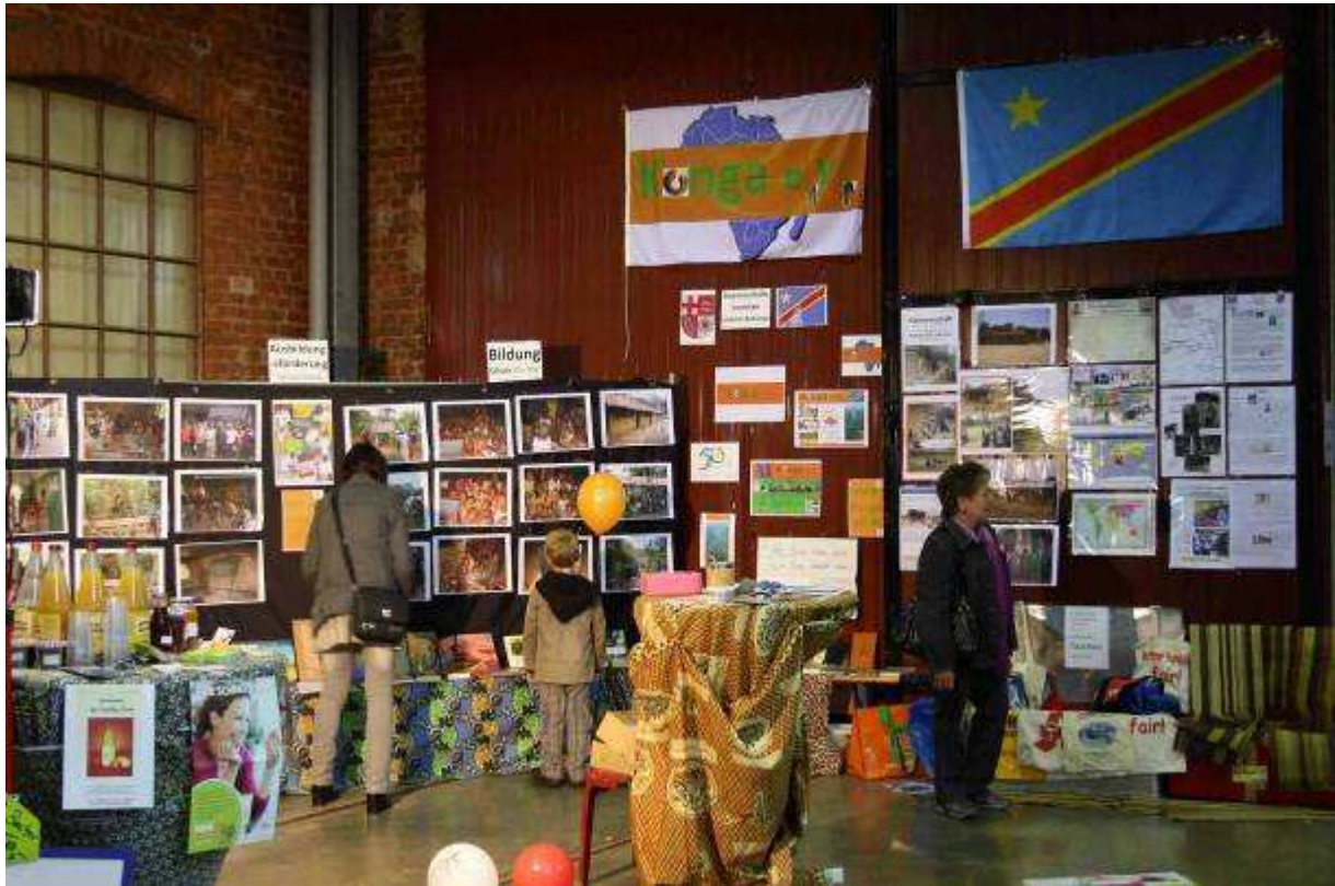
IMG_1178.jpg: Besucher der Kongoausstellung auf der Losheimer Familienmesse.