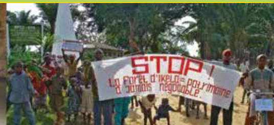
Gegen die Regenwald-Abholzung Brückenbau in Bokungu - Ikela