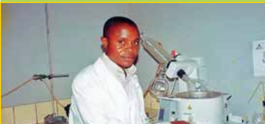
Ausbildung Pharmakologie, Uni Kinshasa Ausbildung Krankenpflege, Medizin

unterstützt den Austausch und die Partnerschaft zwischen Gruppen und auch Einzelpersonen der verschiedenen Kulturen.