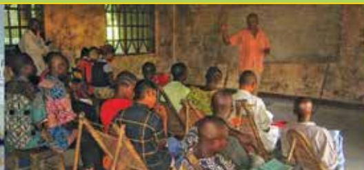
Berufsschule Krankenpflege in Ikela Grundschule Moma Ikela